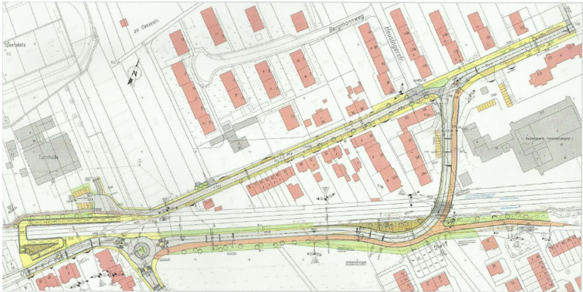
Plan Bahnunterführung Nied.